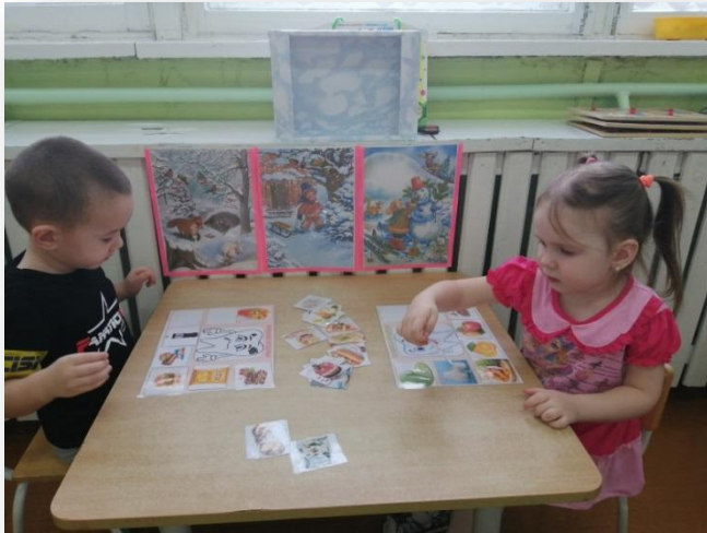
Д/И «Полезные и вредные продукты»