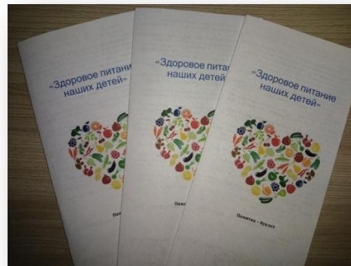
Буклеты «Правильное питание залог здоровья дошкольников»