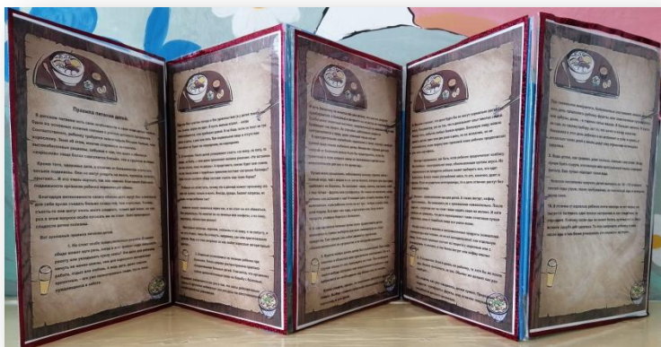
Ширма «Правильное питание»