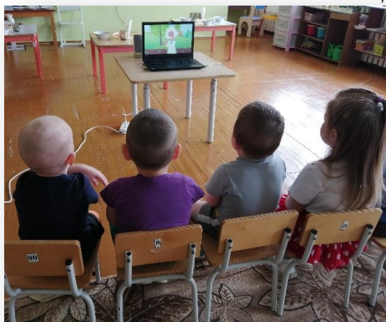
Просмотр мультфильма «Полезная еда» (Синий трактор)