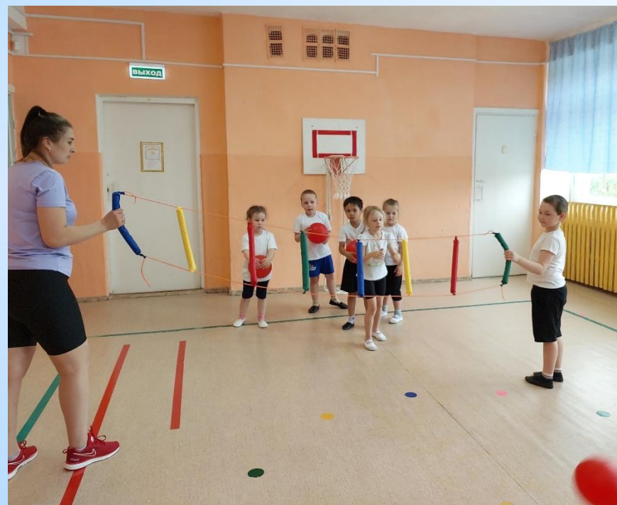
Попади в цель