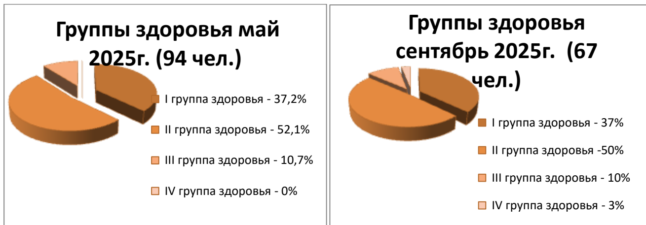
Рисунок 2. Группы здоровья воспитанников

Вывод: в сравнении с результатами диагностики, проведенной в мае 2025 года, наблюдается уменьшение в процентном соотношении количества детей с I группой здоровья; уменьшение в процентном соотношении количества детей со II группой здоровья; уменьшение количества детей с III группой здоровья; и появление детей с IV группой здоровья и остается на одном уровне в процентном соотношении количества детей с V группой здоровья.