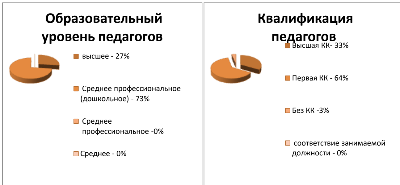
Рисунок 3. Образовательный уровень и квалификация педагогов.