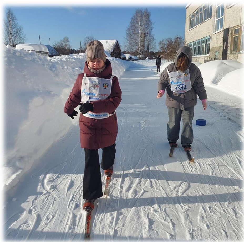
Семейные старты «Лыжня России 2026»