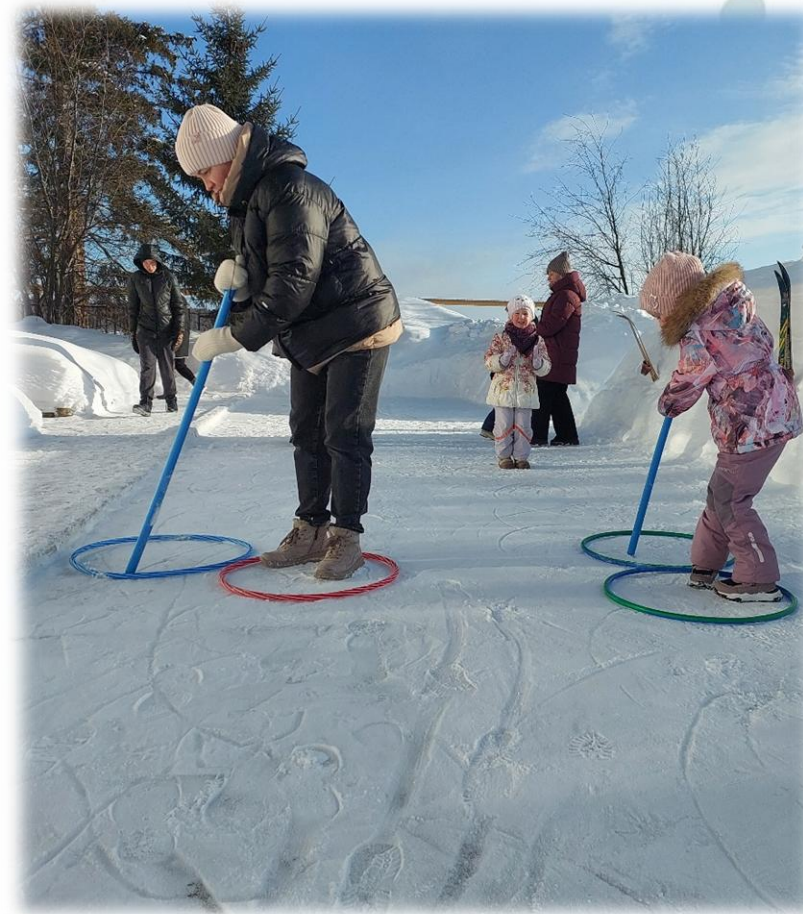
«День здоровья» Мастер-класс на свежем воздухе