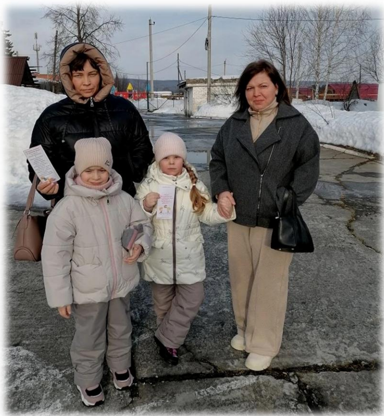
Буклет «Роль двигательной активности для здоровья и развития ребёнка»