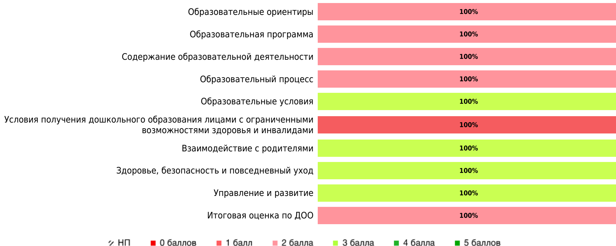
Доли ДОО с разными баллами у педагогов