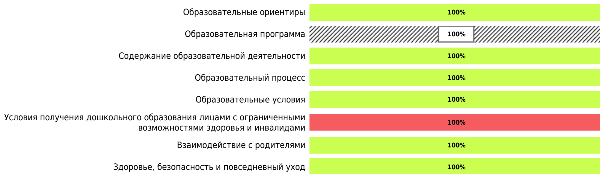
Доли ДОО с разными баллами у их ООП ДО ДОО (самооценка)

В процессе самооценки было оценено 3 ООП ДО ДОО из 1 ДОО субъекта РФ.