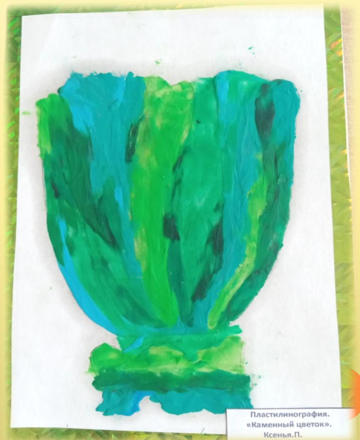
Пластилинография. «Каменный цветок». Ксения.П.